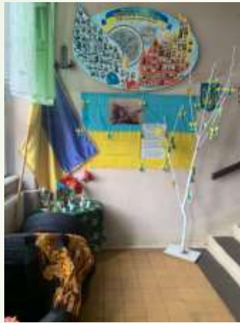
Виставка до відзначення пам'яті Героїв Небесної Сотні