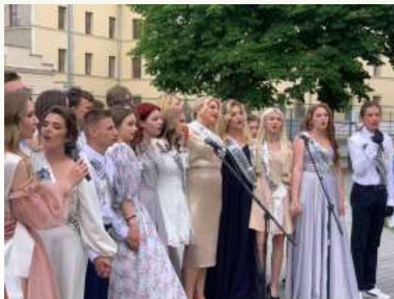
Свято «Прощальний акорд»