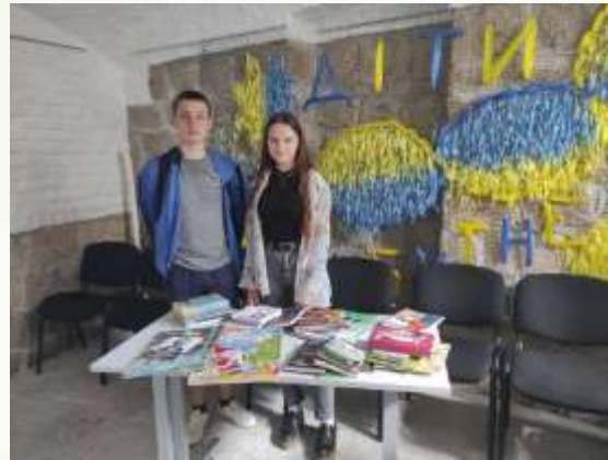
Акція «Читаємо українською разом»