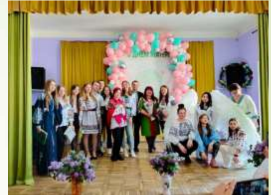
Гурток «Веселі нотки»