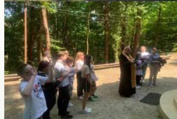
Поїздка у с. Страдч учнів 6 - А класу