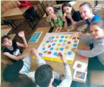
Гурток «Юні поліглоти»

У ЗЗСО № 87 ЛМР ім. Ірини Калинець діяли 4 гуртки