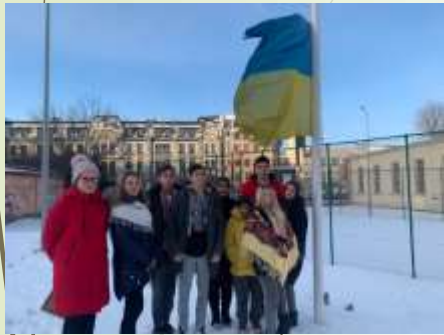
Підняття Державного прапора України