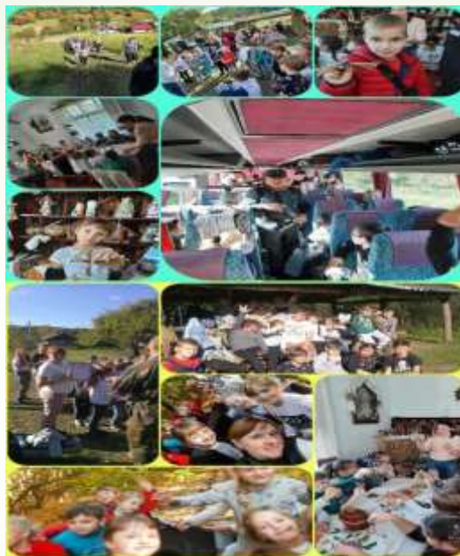
Поїздка учнів 2 -А та 2 -Б класів у Гавареччину