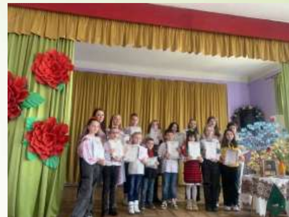
Конкурс читців поезії Тараса Шевченка