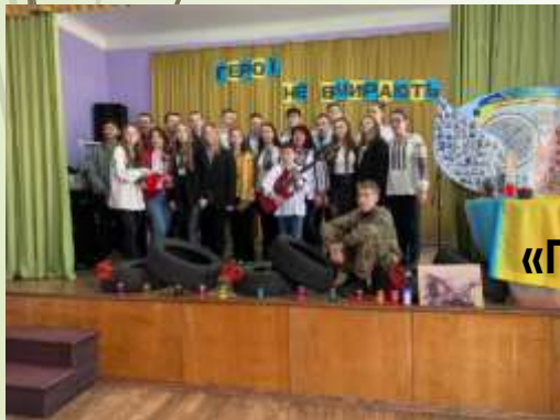
Виховний захід «Герої не вмирають»