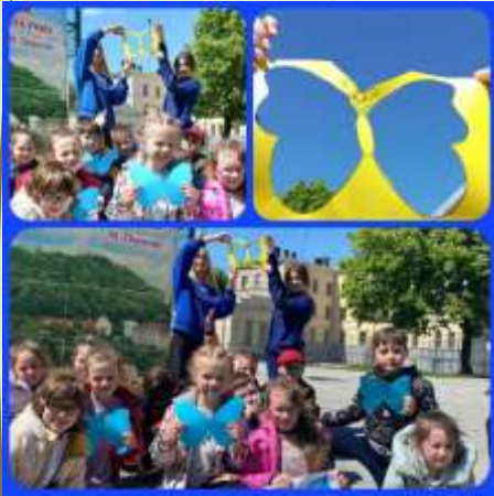
Акція «Легенева терапія»