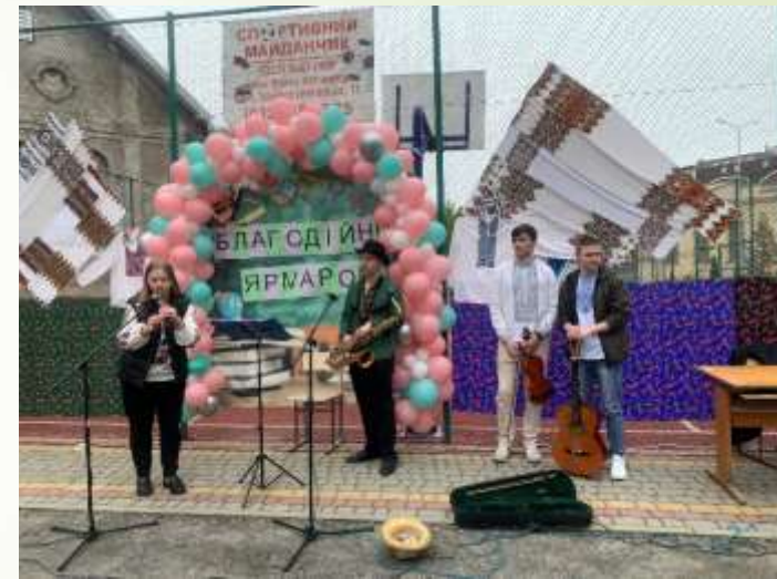
Благодійний ярмарок на підтримку ЗСУ