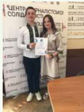
Гурток «Юні журналісти», 2-ге місце у міському конкурсі шкільних медіа «Інтерв'ю, як жанр журналістики»