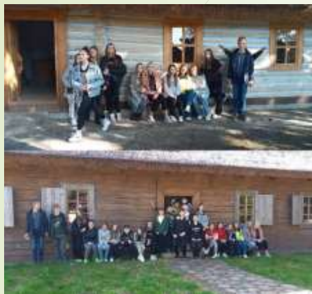
Поїздка учнів 7 -Б, 8 та 9 класів у м.Радивилів, Рівненської області, етноцентр «Ладомирія»